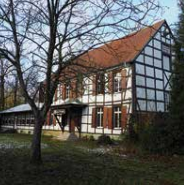
■ Haus Killwinkel