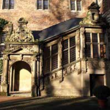
■ Schloss Heessen Detail