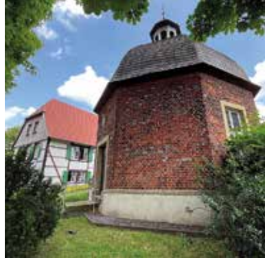
■ Rotes Läppchen und Annenkapelle

Vielleicht entscheiden wir uns ja für ein Wahrzeichen, das nicht auf dem Weg liegt? Oder es gibt mehrere Zeichen, die für einzelne Personen Wahrzeichen sind? Der Spaziergang lebt von den Beiträgen der Spaziergänger und wird kein Vortrag über die besuchten Orte und Denkmale sein.