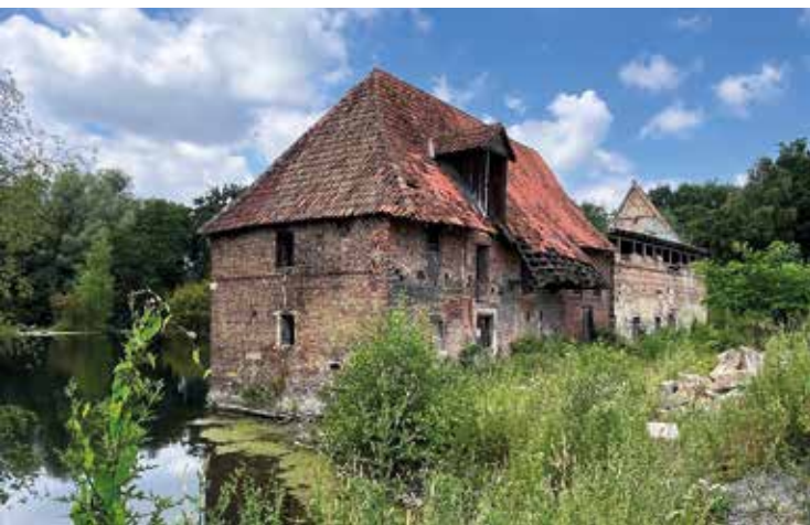
■ Heessener Schlossmühle